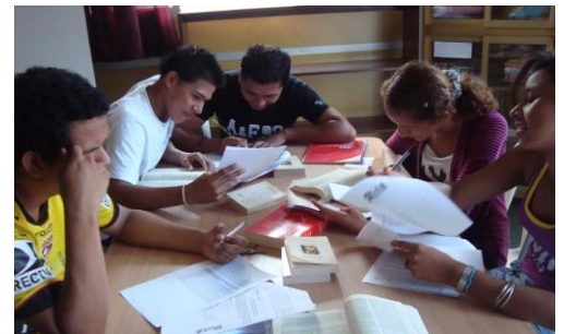
Groupe Espérance et Solidarité, Pascuales

Nous avons aussi organisé une retraite annuelle pour les groupes afin de relire le cheminement spirituel vécu durant l'année. J'aimerais vous partager le témoignage d'une dame faisant partie du Groupe de prière.