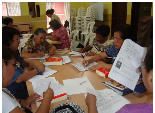
Les Amis de la Miséricorde, Pascuales

Plusieurs rencontres sont vécues à chaque étape de la Démarche Communautaire. Cette façon de procéder favorise une étude progressive des différentes sections de l'étape. Cette approche leur permet, par ailleurs, de prendre le temps de retourner dans leur milieu afin de vivre le message au quotidien et par la suite revenir dans leur groupe pour échanger sur leurs expériences vécues.