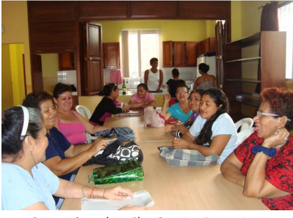
Groupe de prière Mère Rosalie, Pascuales

Vivre ce cheminement spirituel nous a aidés à nous imprégner du charisme de Miséricorde de Mère Rosalie et d'en être « contaminés ». À travers nos partages, nous avons pris conscience de notre engagement à devenir des missionnaires et pasteurs de l'amour miséricordieux de Dieu. Cet appel à la Miséricorde nous interpelle quotidiennement à pratiquer les vertus de Mère Rosalie, d'abord chez nous, ainsi qu'auprès des mères célibataires en difficulté, cheffes de famille et leurs enfants.