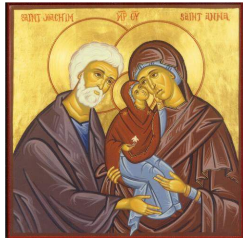
Nativité de Marie